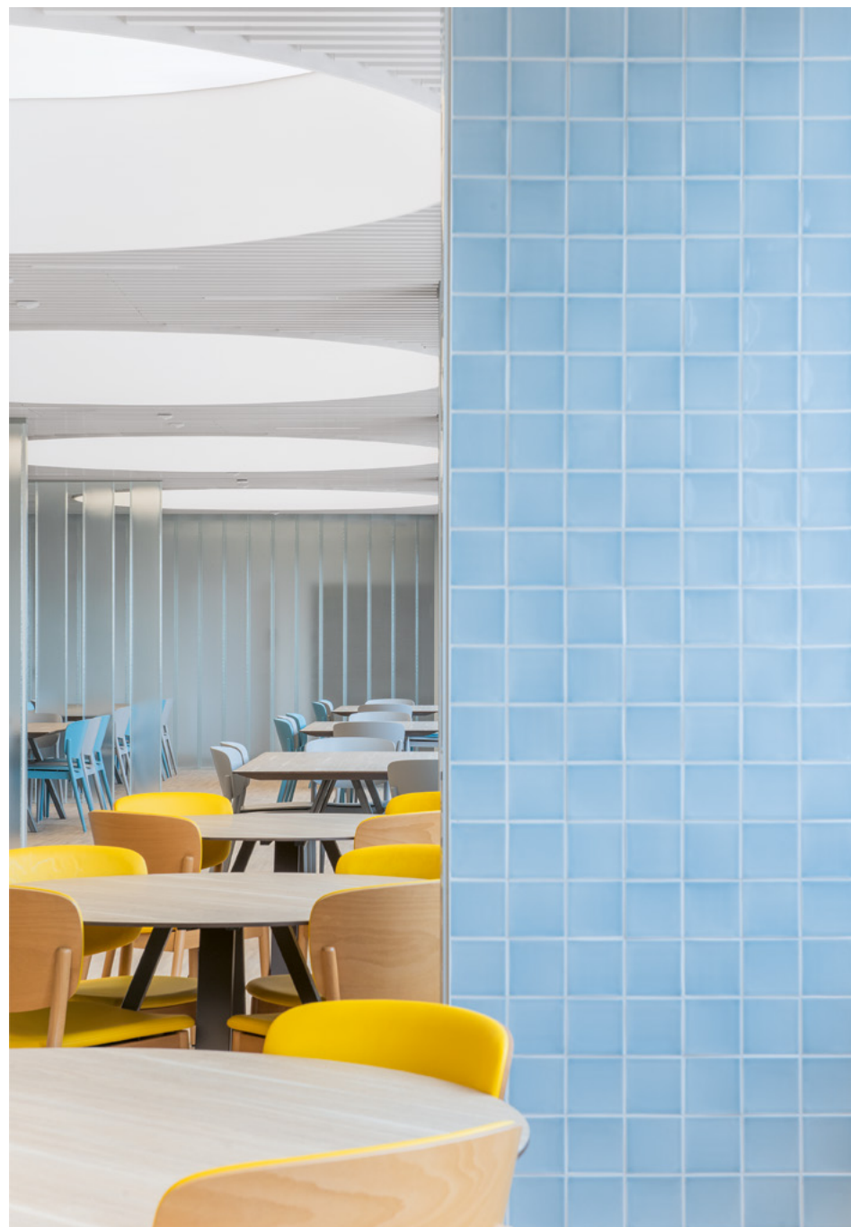
A pillérek között kialakított henger alakú emelések sora növeli a térzetet

Mindkét funkció számára egyértelmű előnnyel járt a szintet keresztbe vágó régi konyha felszámolása, és a két szimmetrikus lépcsőmag összekötése és kiszabadítása. Így lehetővé vált a teljes hosszanti átjárás kétoldali megközelítéssel, és a belső rész jelentős mértékben megnyílt a kilátás és a természetes fény felé. A fellegző tér nagy részét az égszínkék mázas kerámiával burkolt pillérek mellett üvegfallal tagolták. A hol szellősebben, hol szorosabban álló u-profilok az épület alaprajzában és metszetében egyaránt megjelenő lépcsőzetességet ismételve különítik el a közlekedőt és a vendégtérket, és jelölik ki a mozgások irányát – egyúttal a 70-es évek nemzetközi stílusának referenciái. A belmagasság problémáját az étkezőben és a közlekedőből nyíló tárgyalóban is keresztgerendák közötti, henger alakú emelésekkel oldották fel. A látvány a kétféle funkció egységes képének egyik kulcsa, a magasítással fizikailag és érzetileg is tovább nyílik a struktúra.