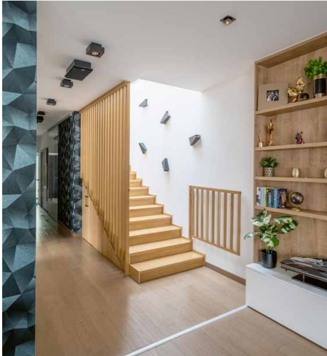
A lépcsőfeljáró prizmaszerű lámpáit különleges fényfestő tulajdonságuk miatt választották, de formájuk a jellegzetes kék tapéta mintájára is rímel.